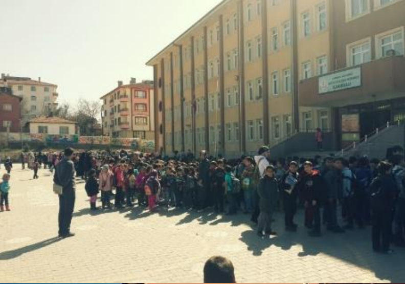
Önder Mah. Altındağ Fatih Sultan Mehmet İlköğretim Okullu 09.03.2015

Suriyelilerin eğitim aldığı okul, burada Suriyeli öğrenciler derslere girmek üzere. Dikkat çekici olan ilkokul öğrencileri hariç, öğrencilerin kız-erkek olarak bölünmüş olması.