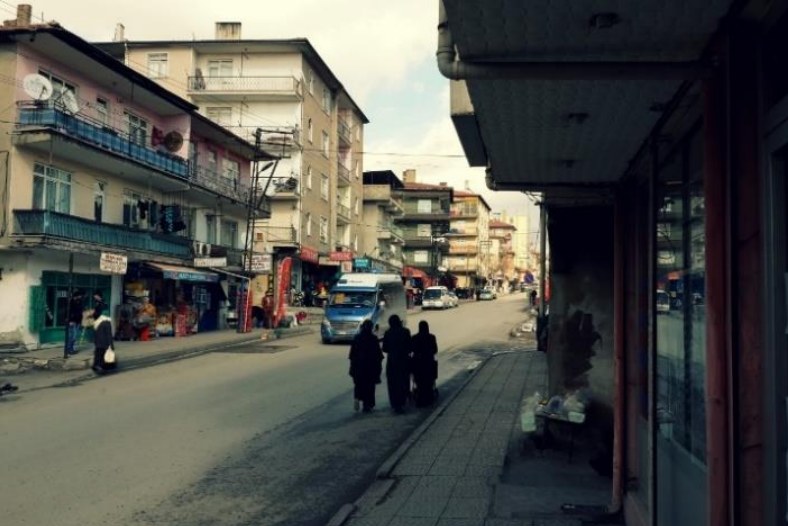
Ulubey Mah. Selçuk Cad. 02.04.2015

Suriyeli esnafların yoğun bulunduğu cadde