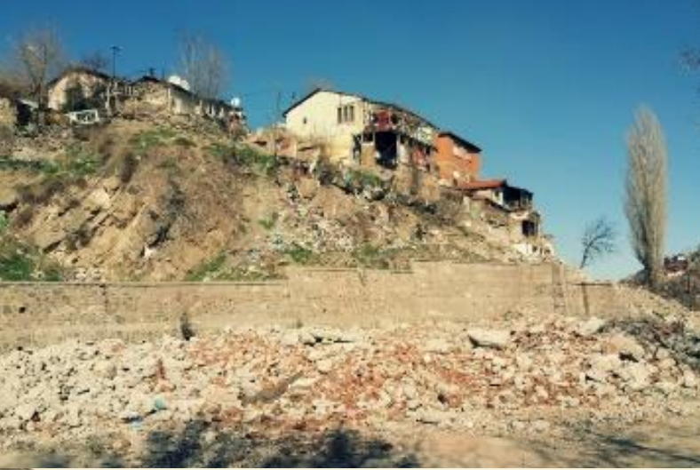
İsmetpaşa Mah. 05.03.2015