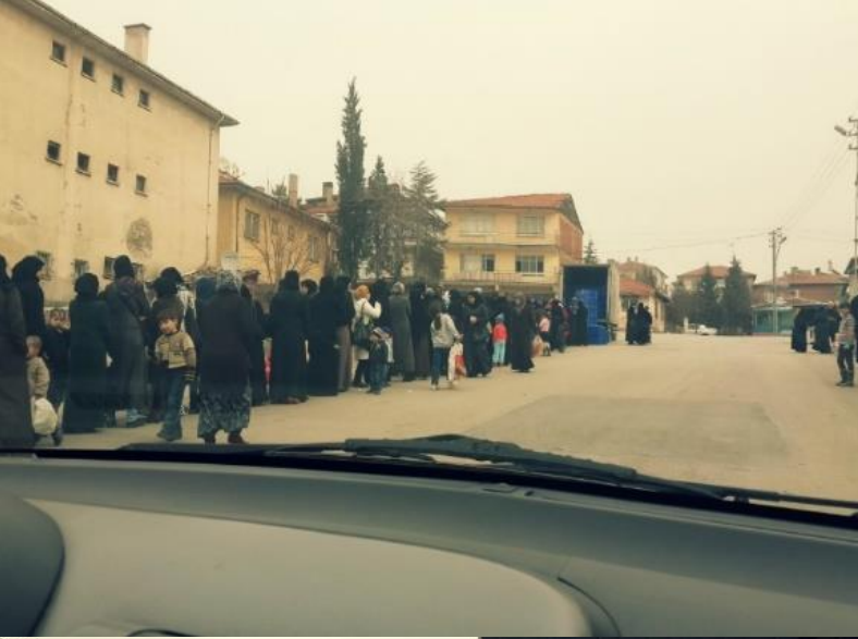
Önder Mah. Öner Sok. 06.03.2015

Her öğlen 12:30 da dağıtılan ekmek yardımı kuyruğu.