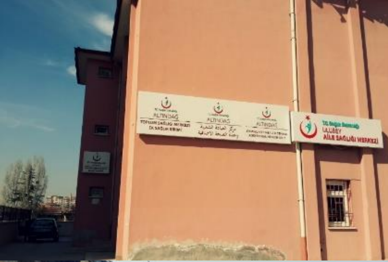
Ulubey Mah. Altındağ 12.03.2015

Suriyelilerin sağlık hizmeti aldığı Sağlık Ocağı.