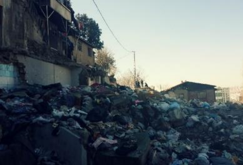
İsmetpaşa Mah. 05.03.2015

İsmetpaşa, Suriyelilerin kaldığı ortam ve yarı yıkılmış konutlar.